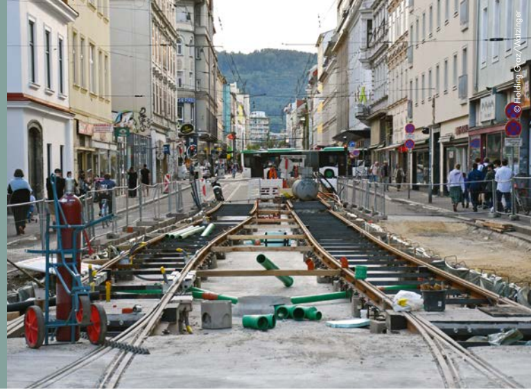
Beim Gleiszusammenschluss in der Annenstraße wurden die neuen Gleise mit den bestehenden Gleisen verbunden.