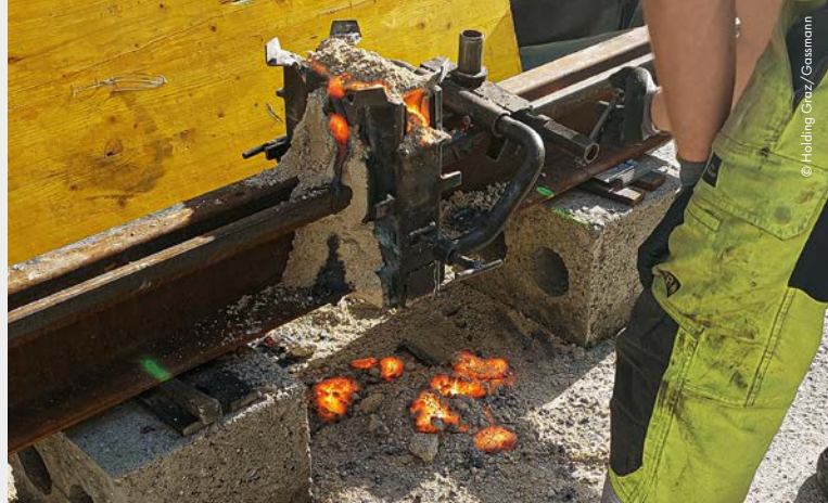
Im Rahmen der Arbeiten zur Neutorlinie wurden unter anderem auch die Schienen verschweißt.

Esserweg, bis Liebenauer Hauptstraße 57: Frühjahr 2026, Erneuern der Wasserleitungen in grabenarmer Bauweise