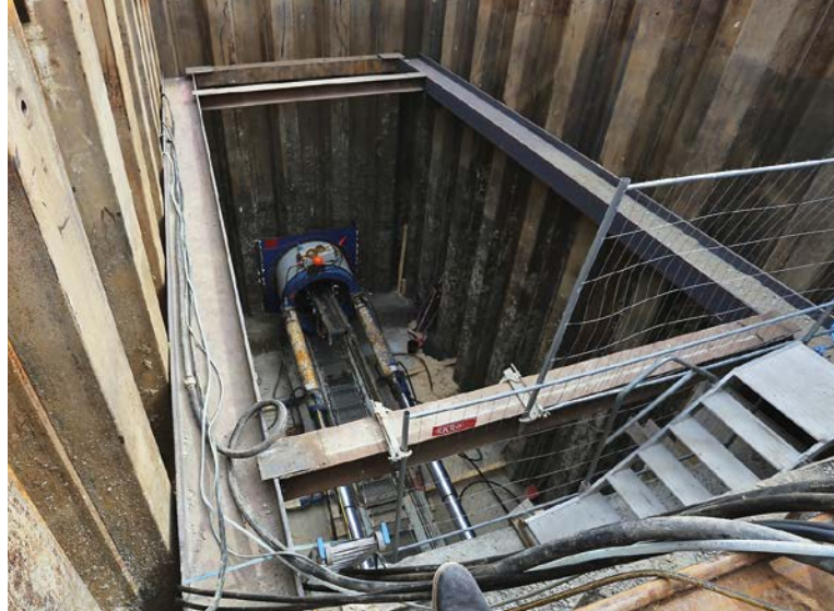
In der Hilmteichstraße entsteht ab November ein Speicherkanal in einer Tiefe von fünf bis zehn Metern (Symbolfoto).

Die Errichtung dieses Speichers ist nur im Rahmen des zweigleisigen Ausbaus der Linie 1 realisierbar. Nach Abschluss der Bauarbeiten wäre ein derartiger Speicher aus Platzgründen nicht mehr umsetzbar. Zudem können durch die gleichzeitige Umsetzung Synergien genutzt und Bauabläufe effizienter gestaltet werden.